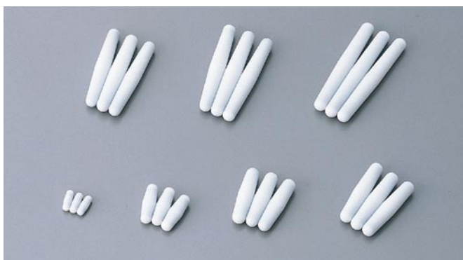
オクタゴン回転子 STIRRING BAR