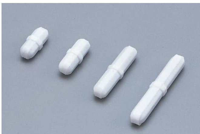
オーバル回転子 STIRRING BAR