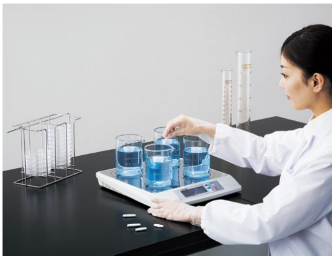
ラボラン回転子 STIRRING BAR