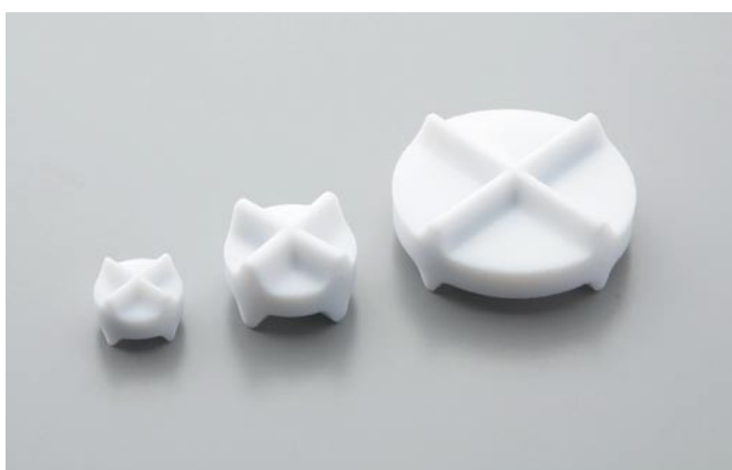
クロスヘッド回転子ダブル STIRRING BAR